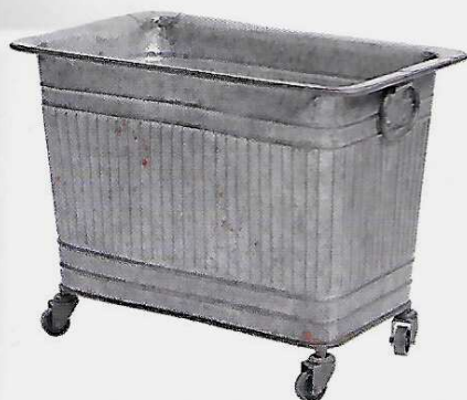
On aime le côté brut de ce conteneur métallique pour plantes monté sur roulettes. 250 €. Nordal.