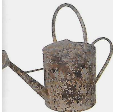
Le shabby chic investit le jardin avec cet arrosoir en métal patiné. H. 56 x 42 x Ø 22 cm. 29,90 €. Wohnflair.

Avec ses finitions savamment usées et patinées, le style shabby mélange l'esprit country chic à l'anglaise et les pièces vintage. Le « shabby » désignant un aspect « usagé » et « fané », il se traduit naturellement par des éléments décoratifs récup' dans un registre « bric et broc ». Au jardin, ce sont des jardinières vintage, des pots en terre cuite ou des paniers tressés qui prennent l'avantage. Baignoires et accessoires en zinc, mobilier en fer forgé font aussi partie de l'ADN shabby. Les contenants pour plantes y trouvent une place de choix et mettent en scène de façon champêtre et informelles toutes les variétés du jardin. —