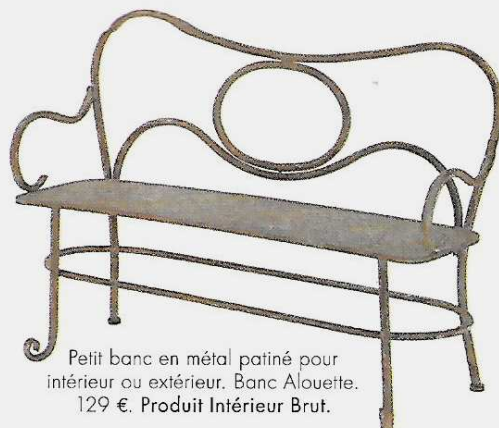
Petit banc en métal patiné pour intérieur ou extérieur. Banc Alouette. 129 €. Produit Intérieur Brut.

F icelle naturelle, fer rouillé, vases style Médicis, jarre antique... Autant de marqueurs qui garantissent à nos jardins un look très authentique que les fabricants ne se lassent pas d'imiter, toujours dans un esprit brocante. Ces objets, sortis tout droit du passé, semblent avoir habité nos espaces verts depuis des lustres. Charme désuet du style 1900 ou élégance « shabby chic » ? Tous les goûts sont dans les boutiques.