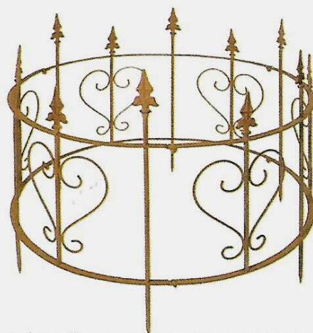
Le fer rouillé apporte une touche incontestablement nostalgique et traditionnelle comme en témoigne cette décoration de massif. H. 66 x Ø 77 cm. 69 €. Country Garden.

Ce style est emblématique des jardins romantiques et traditionnels. Lignes courbes et oblongues, volutes en fer forgé marquent cette époque qui a vu exploser le mobilier de jardin. Aujourd'hui, des boutiques les plus branchées aux plus classiques,