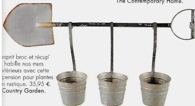
l'esprit broc et récup' habille nos murs extérieurs avec cette suspension pour plantes en métal rustique. 35,95 €. Country Garden.