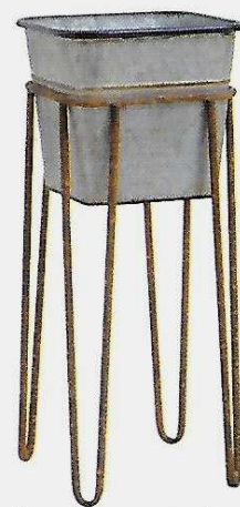
Pour donner au jardin un côté brut et authentique, un porte-plantes en métal vieilli. 59 €. Nordal.

impossible de passer à côté de ces décors iconiques. Ils ne cessent d'être copiés, revisités ou d'inspirer le mobilier contemporain. L'esprit début de siècle est également marqué par la présence du zinc qui se répand à l'époque dans toute l'Europe. Ce matériau incarne à lui seul le charme des jardins d'autrefois. On mise sur les seaux, arrosoirs et jardinières patinés qui apportent des accents très campagne.